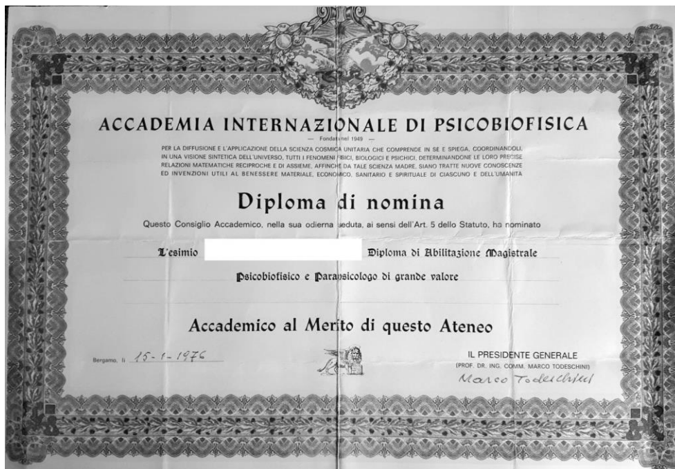
esempio di DIPLOMA DI NOMINA dell'ACCADEMIA INTERNAZIONALE DI PSICOBIOFISICA